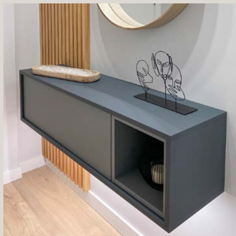
Mueble recibidor de entrada con Led inferior