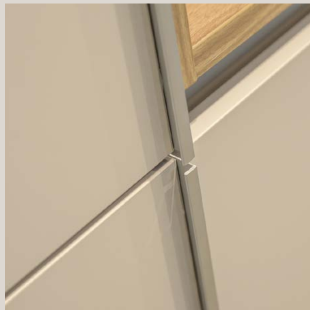
Columnas de cocina con hueco decorativo para pequeños electrodomésticos. Las líneas quedan perfectamente definidas gracias a las golas horizontales y los tiradores verticales de pestaña TA86 en toda la altura de puerta.