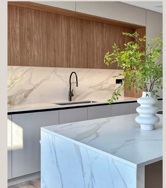
Cocina estilo puente, con una elegante combinación de laminado Nogal Dunkerque y PET Terra. Equipada con tirador al canto T1635 en aluminio anodizado negro mate.