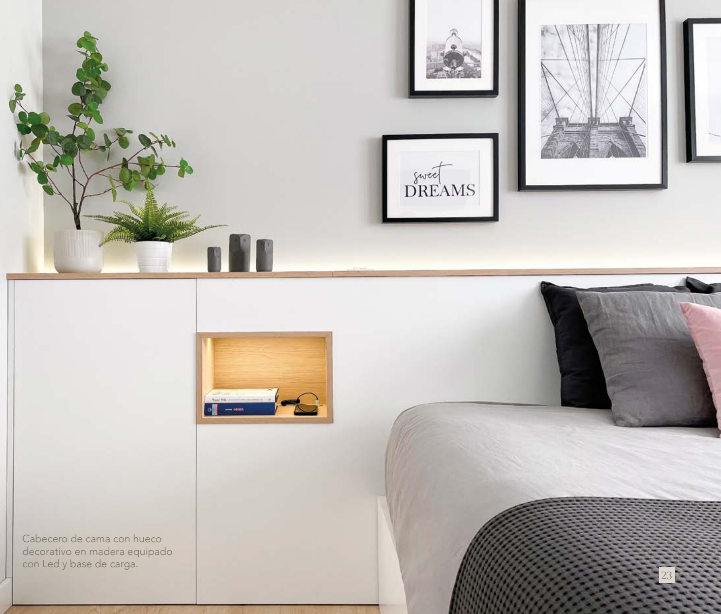
Cabecero de cama con hueco decorativo en madera equipado con Led y base de carga.

Proyectos bellos y funcionales, espacios para todo el hogar.