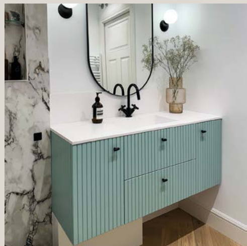
Mueble de baño alistonado