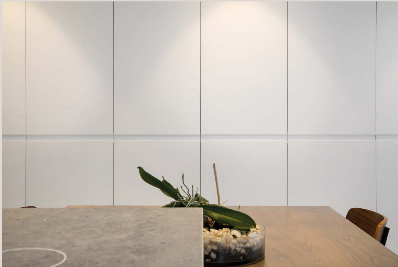
Cocina modelo Tokio lacada en Blanco Seda Mate, con una elegante encimera de mesa sobre estructura de acero negro que rodea la isla central. La encimera de la isla cuenta con inducción invisible y una campana integrada en el techo.