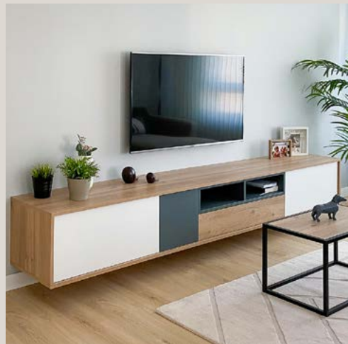
Mueble de salón suspendido