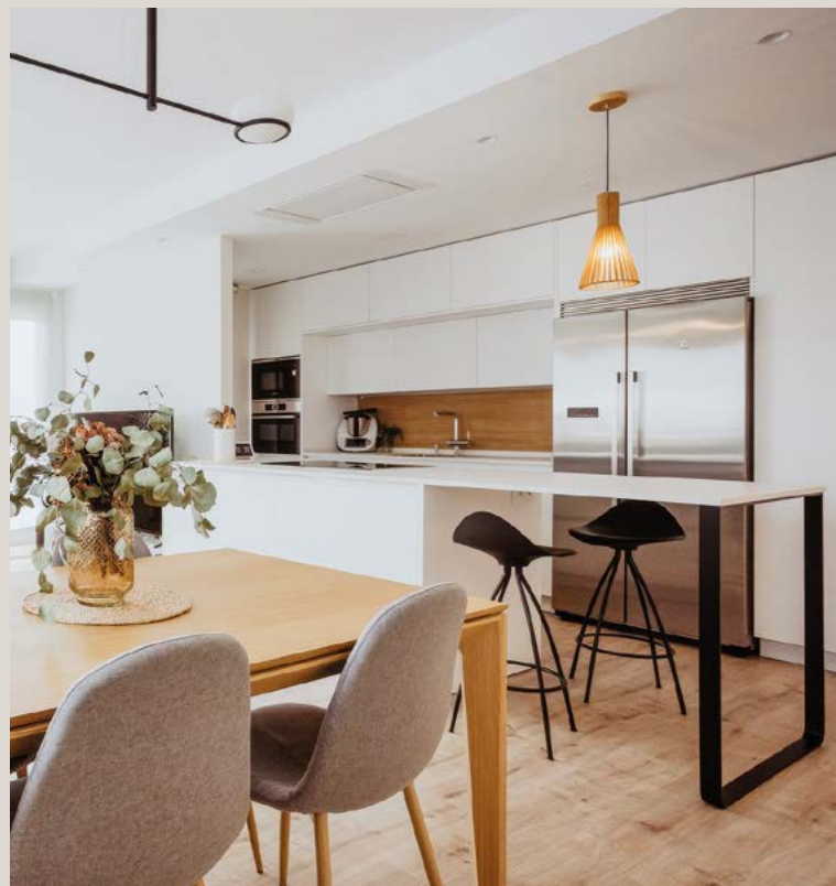
Cocina estilo puente lacada en blanco puro de Gama Express, golas y zócalos blancos a juego. Destaca la pata en U fabricada a medida en estructura de aluminio negro mate. El frontal del fregadero está realizado en compacto fenólico con acabado Roble Nature.

Con Arnit cada posibilidad se convierte en idea, y cada idea, en un proyecto de decoración.