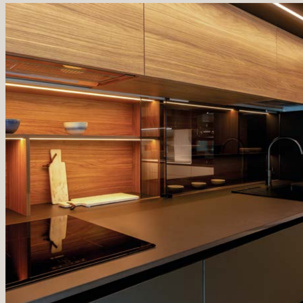
Cocina lineal de estilo puente con un elegante diseño simétrico en columnas, combinando Fenix Negro con muebles altos en laminado nogal. Destaca la solución lateral del horno microondas, así como el doble fondo del entrepaño, equipado con puertas de cristal Float Gris e interior en nogal con retroiluminación Led.